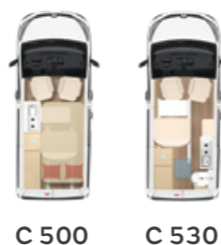
C 500 C 530