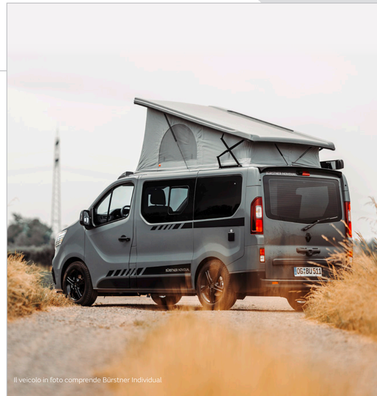
Il veicolo in foto comprende Bürstner Individual