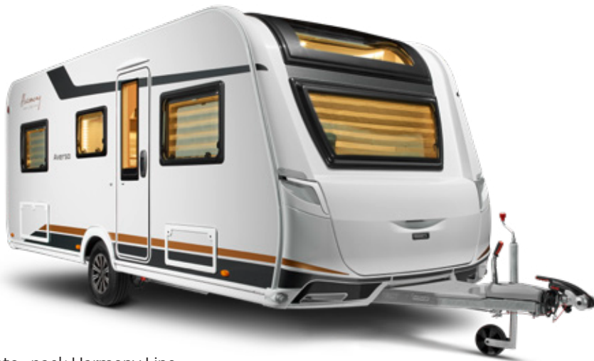
Photo : pack Harmony Line