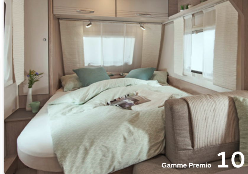
Gamme Premio 10