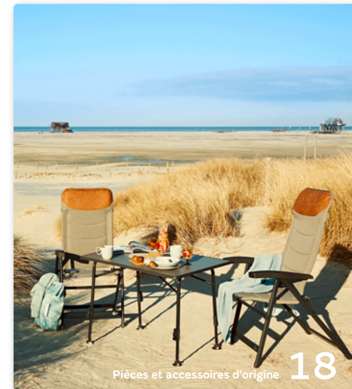
Pièces et accessoires d'origine 18