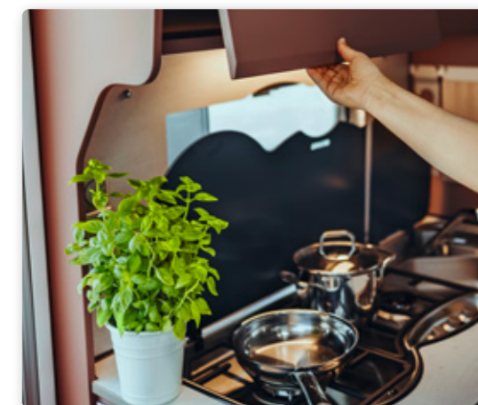
Les photos sont présentées à titre indicatif.

Véritable joyau pour les épicuriens exigeants, la caravane Averso Plus offre un grand confort et beaucoup d'espaces de rangement avec son équipement élégant et moderne. L'application My Bürstner apporte des fonctions utiles et une parfaite connectivité.