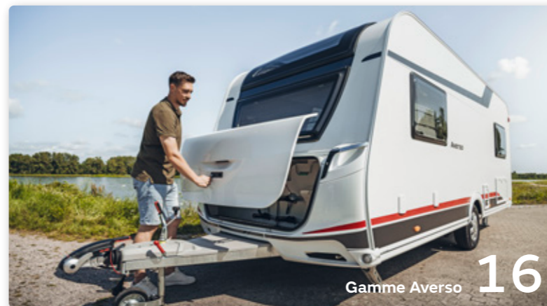
Gamme Averso 16